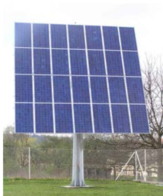
Impianto non integrato