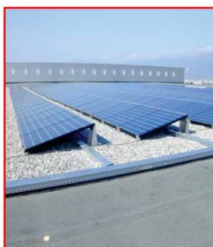
Impianto parzialmente integrato